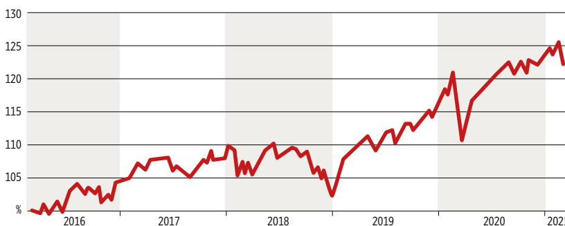
WERTENTWICKLUNG FVM-CLASSIC UI IN %

Indiziert bei 100 Prozent; Quelle: Bloomberg