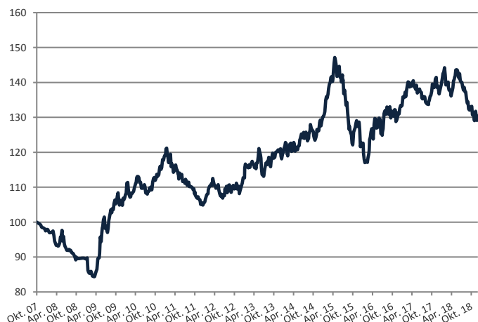
Wertentwicklungen der Vergangenheit sind kein verlässlicher Indikator für die künftige Wertentwicklung.