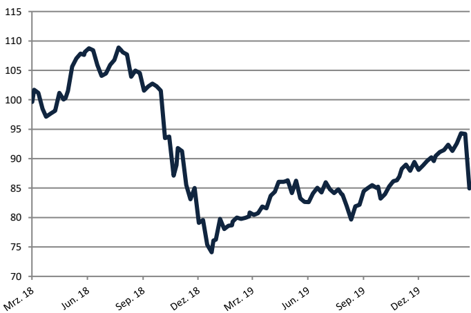
Wertentwicklungen der Vergangenheit sind kein verlässlicher Indikator für die künftige Wertentwicklung.